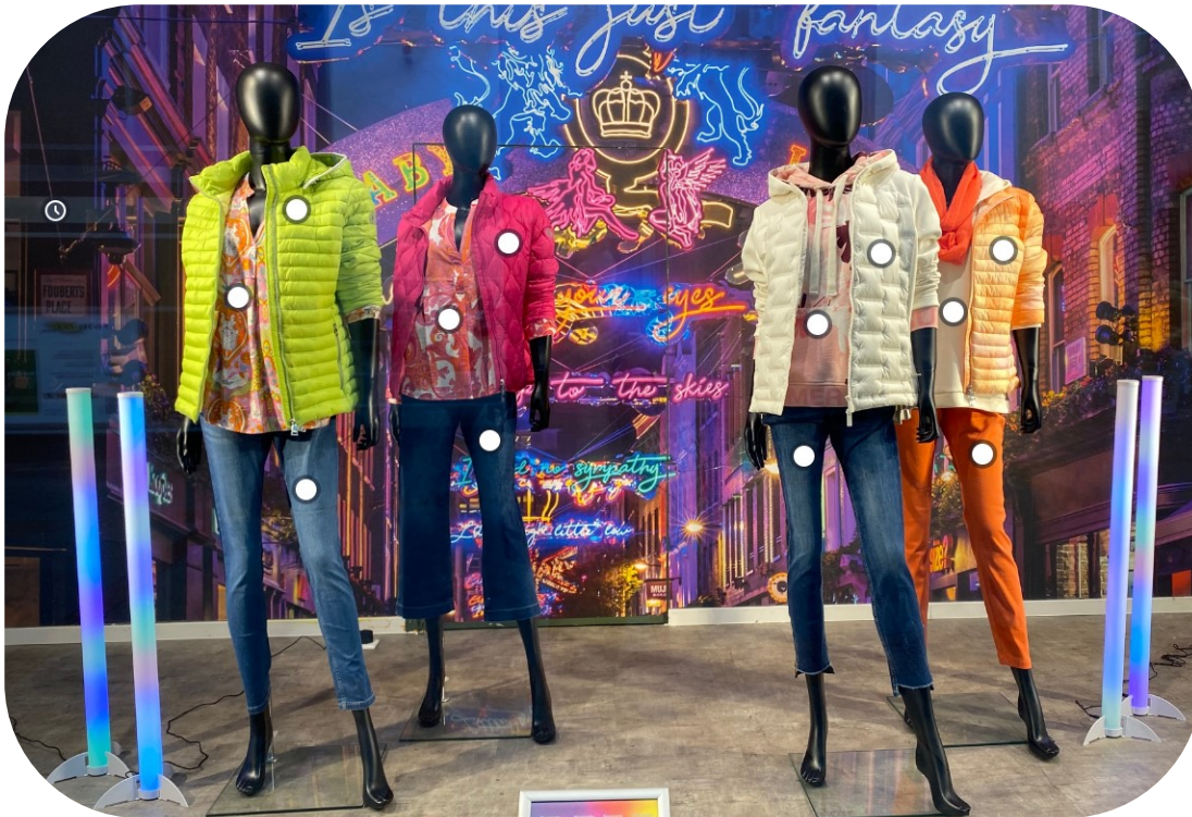
Digitales Schaufenster aus der Modellkommune Iserlohn, B&U Modehaus

mit Mehrwerten schaffen zu können. Nach umfangreicher interner Pilotierung konnte zum Jahresende 2021 das Digitale Schaufenster in der Praxis getestet werden. Einige Händler zeigten reges Interesse, das Schaufenster umzusetzen.